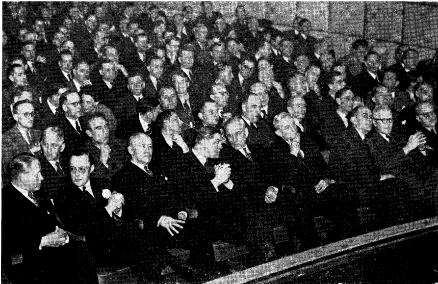
Een deel der 1400 bezoekers van het Congres van de Arbeid op Donderdag 13 Januari 1949.